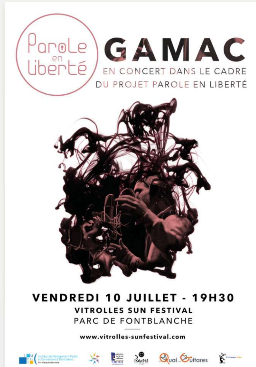
Illustration Mise en page