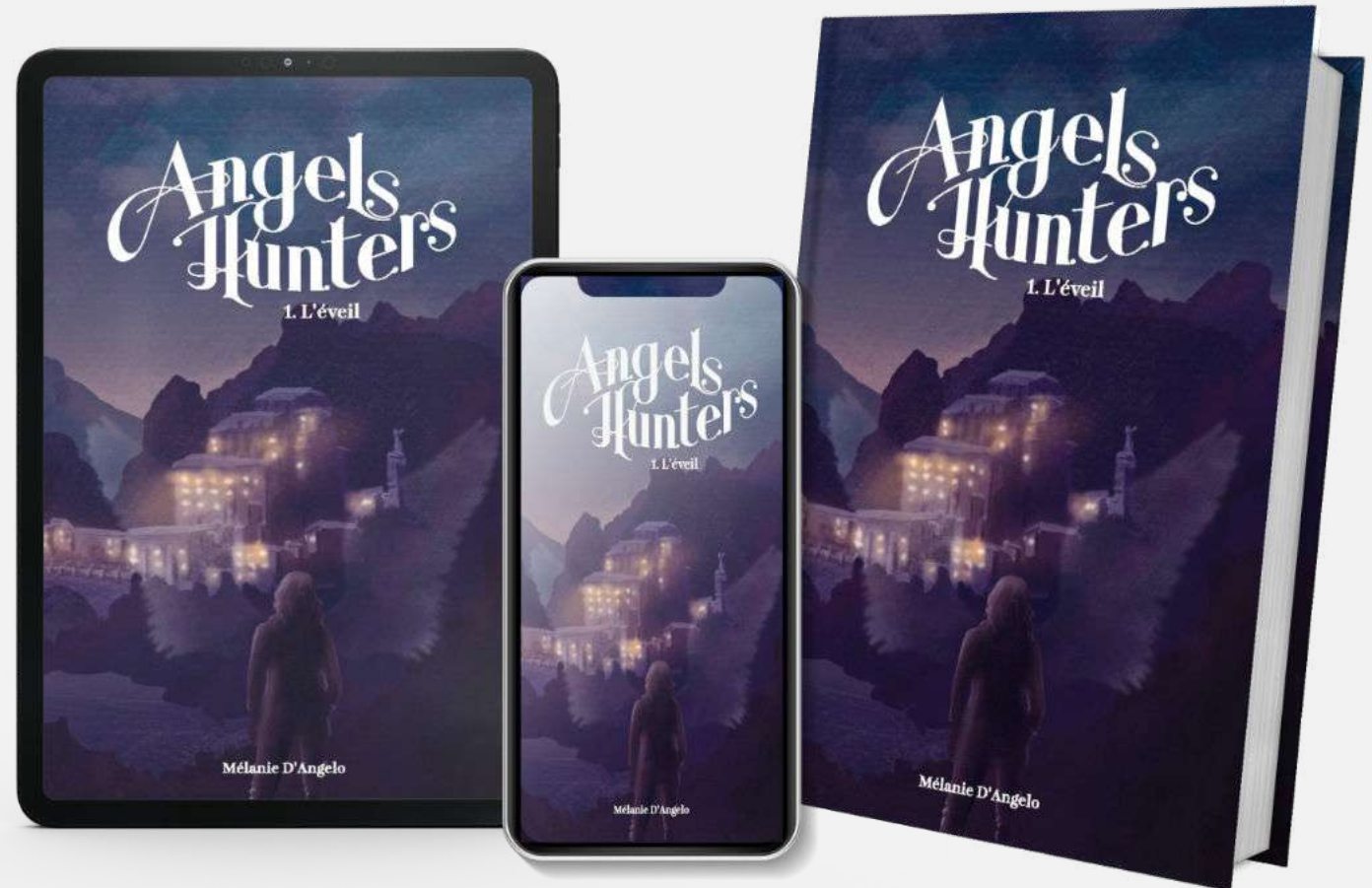
Illustration Mise en page Prépresse